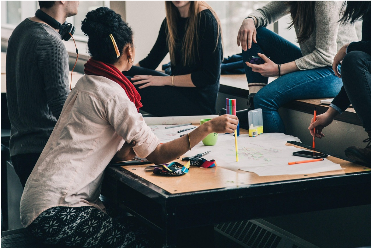
Estudiantes Movilidad Saliente