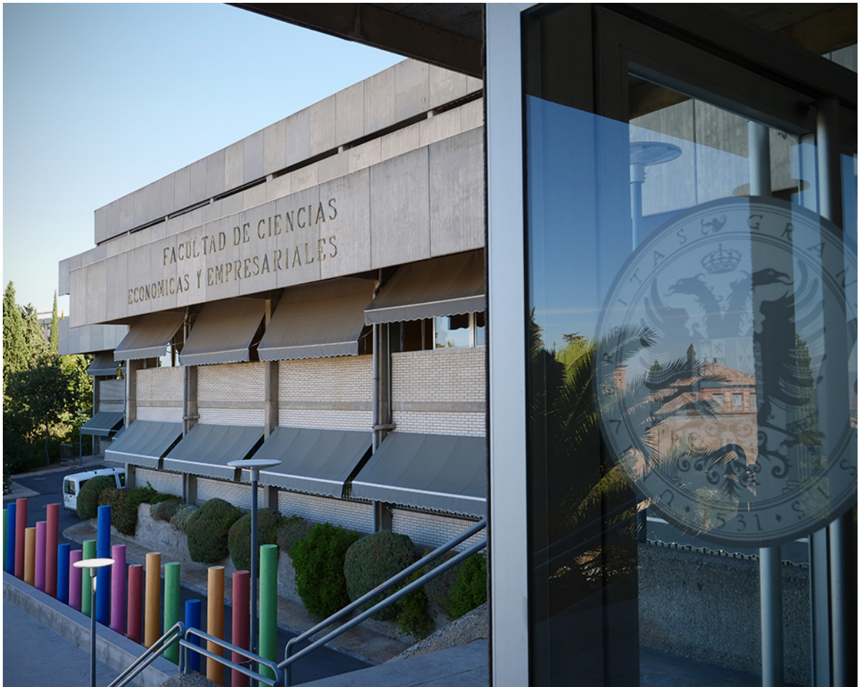
Saludo del equipo decanal