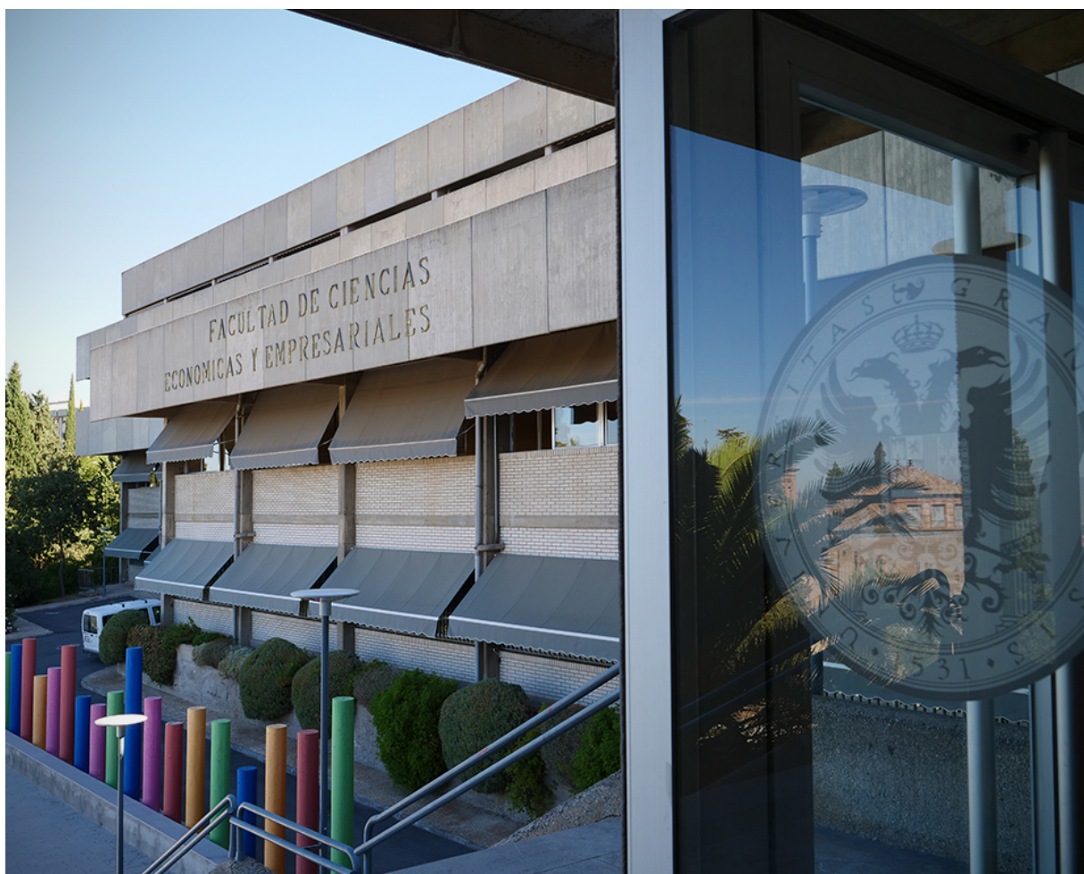
Saludo del equipo decanal